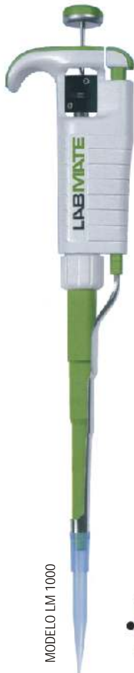
MODELO LM 1000