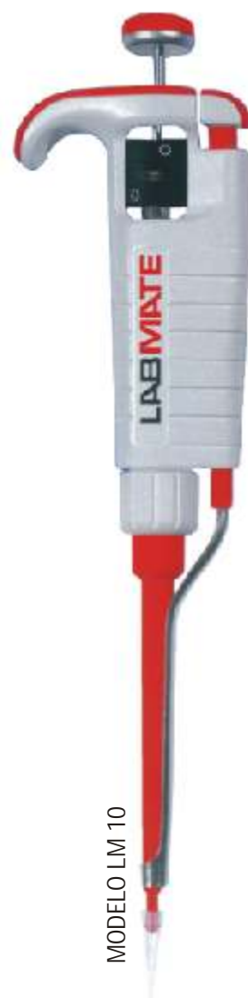
MODELO LM 10