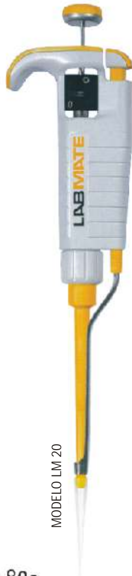
MODELO LM 20