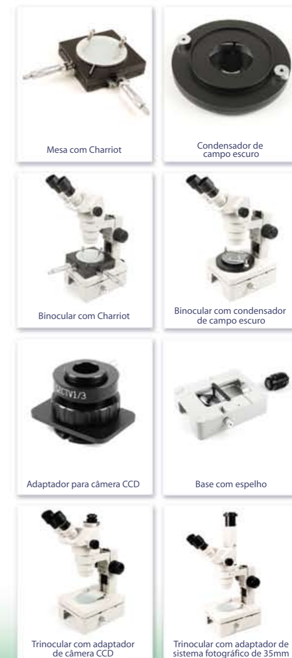
Mesa com Charriot